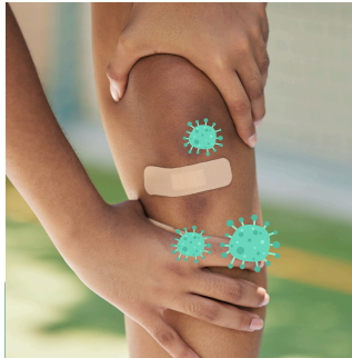
OBTENER ESPORAS EN UN CORTE O RASPADURA

El ántrax no es contagioso, lo que significa que no puede contraerlo de otra persona como el resfriado o la gripe.