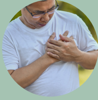
Molestias en el pecho