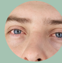
cara roja y ojos rojos