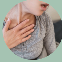
Dificultad para respirar