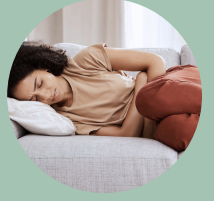
Náuseas, vómitos con sangre y dolores de estómago