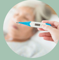
Fiebre y escalofríos