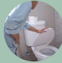
Diarrea o diarrea sanguinolenta