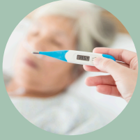
Fiebre y escalofríos

Los síntomas del ántrax gastrointestinal incluyen: