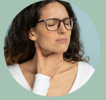
Dolor al tragar