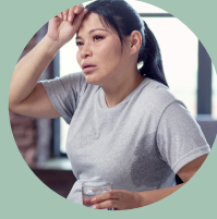
Sudores (a menudo empapados)