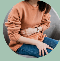
Hinchazón del abdomen (estómago)