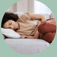
Náuseas, vómitos o dolores de estómago