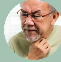
Hinchazón del cuello o de las glándulas del cuello