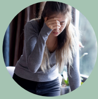
Confusión o mareos