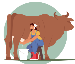
Trabajar con animales o productos animales infectados

Ciertas actividades pueden aumentar el riesgo de contraer ántrax, como: